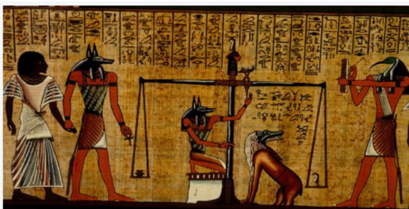
El libro de los muertos egipcio fue una de las primeras obras literarias.