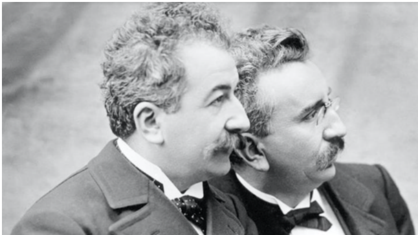
Auguste Marie y Louis Jean Lumière.

Por eso, el cine ha devenido hoy en día un asunto masivo. Aunque existen proyectos que se llevan a cabo con fondos limitados, habitualmente cada uno requiere grandes inversiones por parte de los centros cinematográficos como Hollywood en EEUU o Bollywood en India.