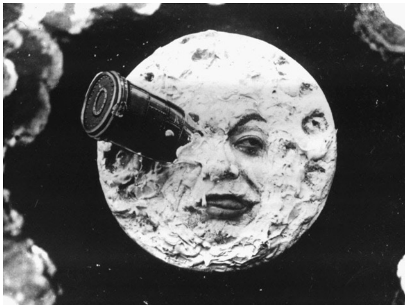
Fotograma de una película de George Méliès, el padre de la ciencia ficción.

Todas las primeras cintas cinematográficas eran tomas documentales. Por ejemplo, puede observarse un bebé almorzando, obreros derribando una pared, un tren arribando a la estación, entre otras.