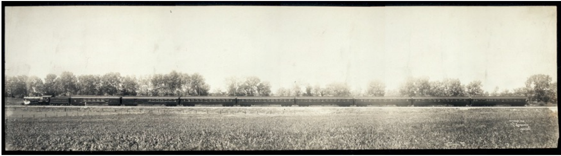
The Largest Photograph in the World of the Handsomest train in the World. 1900. George R. Lawrence