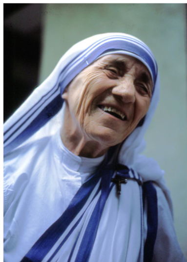
Madre Teresa de Calcuta

«La paz no es solamente la ausencia de la guerra; mientras haya pobreza, racismo, discriminación y exclusión difícilmente podremos alcanzar un mundo de paz»