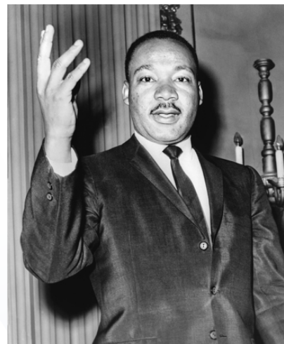
Martin Luther King

En una de sus primeras acciones, lideró el Boicot a los autobuses de Montgomery para acabar con la marginación racial en el transporte público. En 1963, ayudó a organizar la Marcha sobre Washington. Casi 250,000 personas asistieron en un esfuerzo para mostrar la importancia de una justicia igual para todos. Esperaban conseguir el fin de la segregación en las escuelas públicas, la protección contra el abuso policial y la redacción de leyes que previnieran la discriminación en el empleo y en otras áreas de la vida.