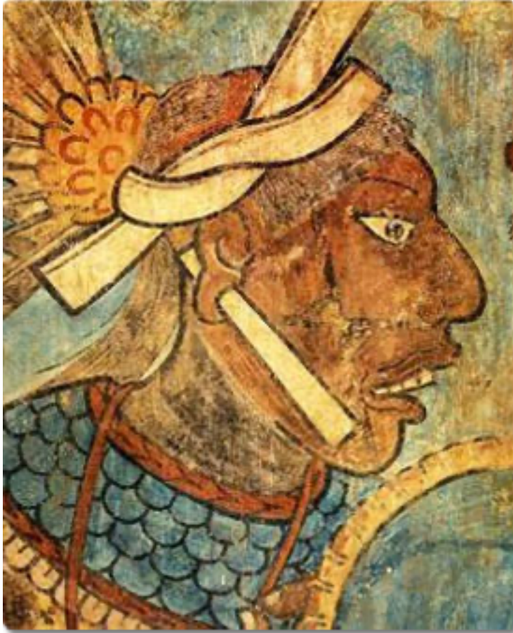
Detalle de un mural de Cacaxtla

Mesoamérica es el área cultural más estudiada de la época prehispánica. Fue Paul Kirchhoff quien estableció en 1943 en el artículo "Mesoamérica, sus límites geográficos, composición étnica y características culturales" sus fronteras geográficas y culturales.