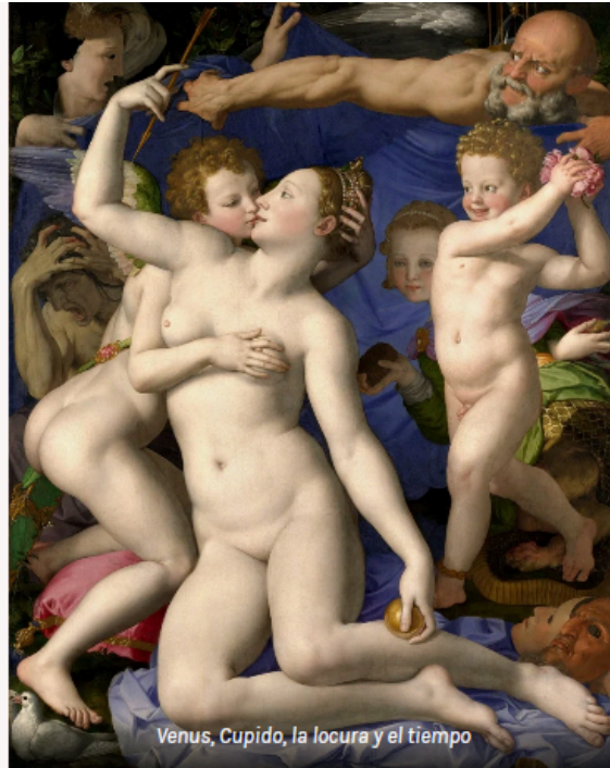
Venus, Cupido, la locura y el tiempo

En los restantes estados europeos, la pintura manierista aparece con frecuencia en relación con la presencia de artistas italianos.