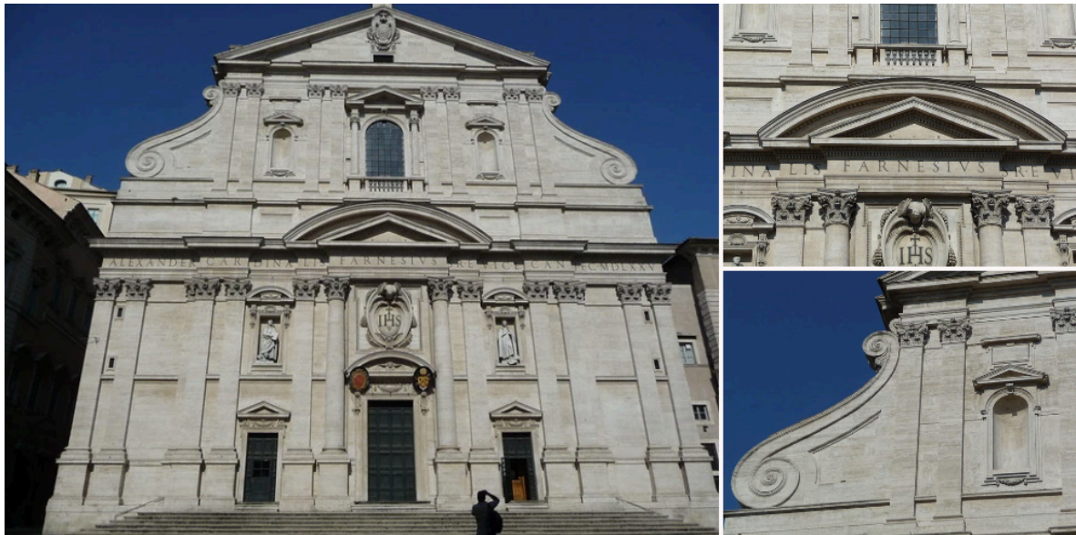
Iglesia de Gesú, Roma.