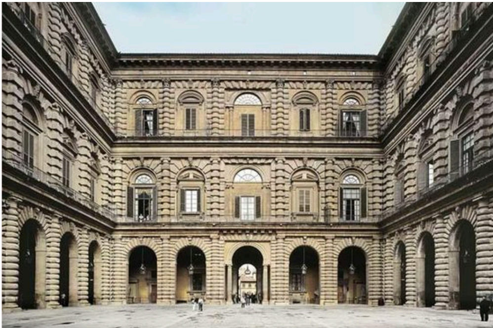
Palacio Pitti, Florencia.