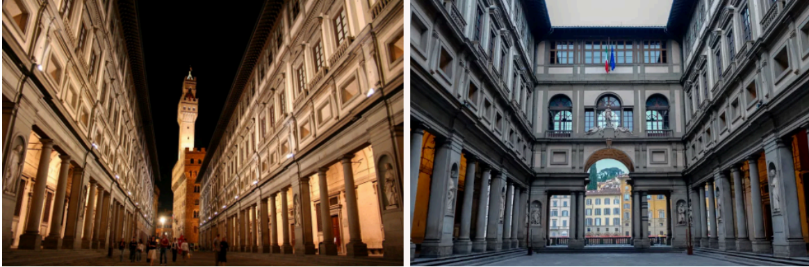
Palacio Uffizi, Florencia.