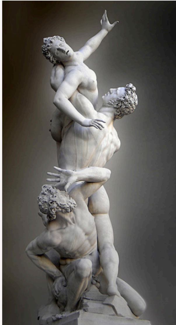
Mercurio y Rapto de las Sabinas.

La tensión y el desgarramiento propios del estilo aparecen en la exagerada musculatura del Perseo de Benvenuto Cellini (1500-1571). Cellini, aprendió el arte de la escultura y de la orfebrería en varios talleres de Florencia y Pisa, hasta que abrió su propio obrador en Roma. Trabajó como orfebre al servicio de Francisco I, para quien realizó una de las más bellas piezas de orfebrería renacentista: el Salero de Francisco I (1543).