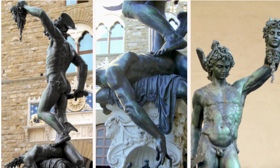
Perseo de Benvenuto Cellini.