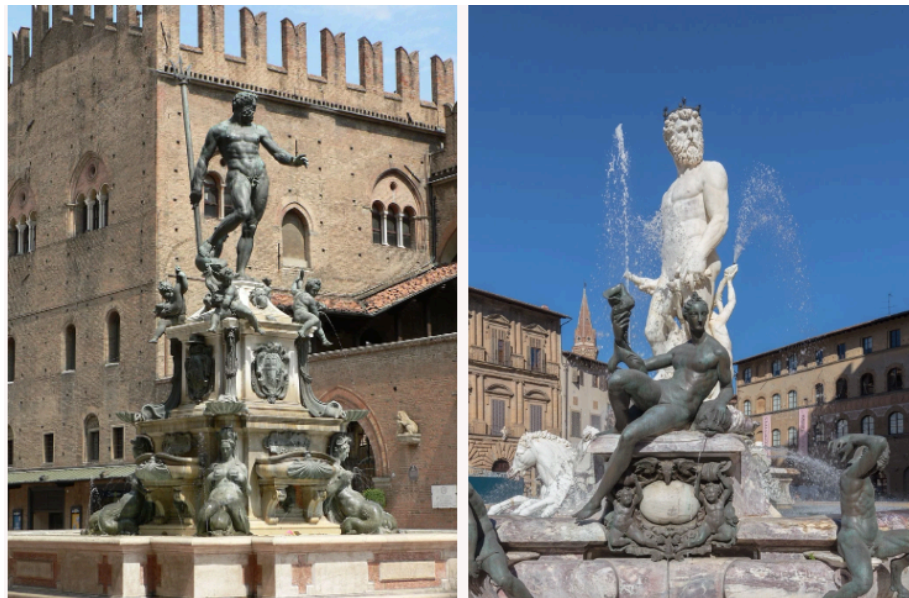
Fuente de Neptuno de Bolonia / Fuente de Neptuno de Florencia.

Sin embargo, será en la Fuente de Neptuno en Florencia donde se exaltan con mayor libertad las figuras contorsionantes. Autoría de Batolomeo Ammannati (1511-1592), fue seleccionada en un concurso frente a los diseños de Cellini y Juan de Bolonia para ser colocada en el Palazzo Vecchio de Florencia.