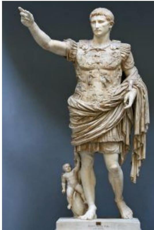
Augustus von Prima Porta (20-17v. Chr), aus der Villa Livia in Prima Porta. 1863.

En los capiteles románicos se esculpen historias de carácter narrativo y fantástico en forma de relieve corrido que representan vicios y pasajes bíblicos. Sin embargo, los temas en la escultura exenta se limitan a La Virgen y a Cristo crucificado ausente de dolor.