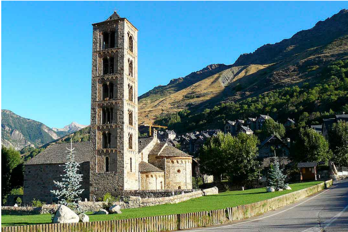
Iglesia de San Clemente de Tahull.