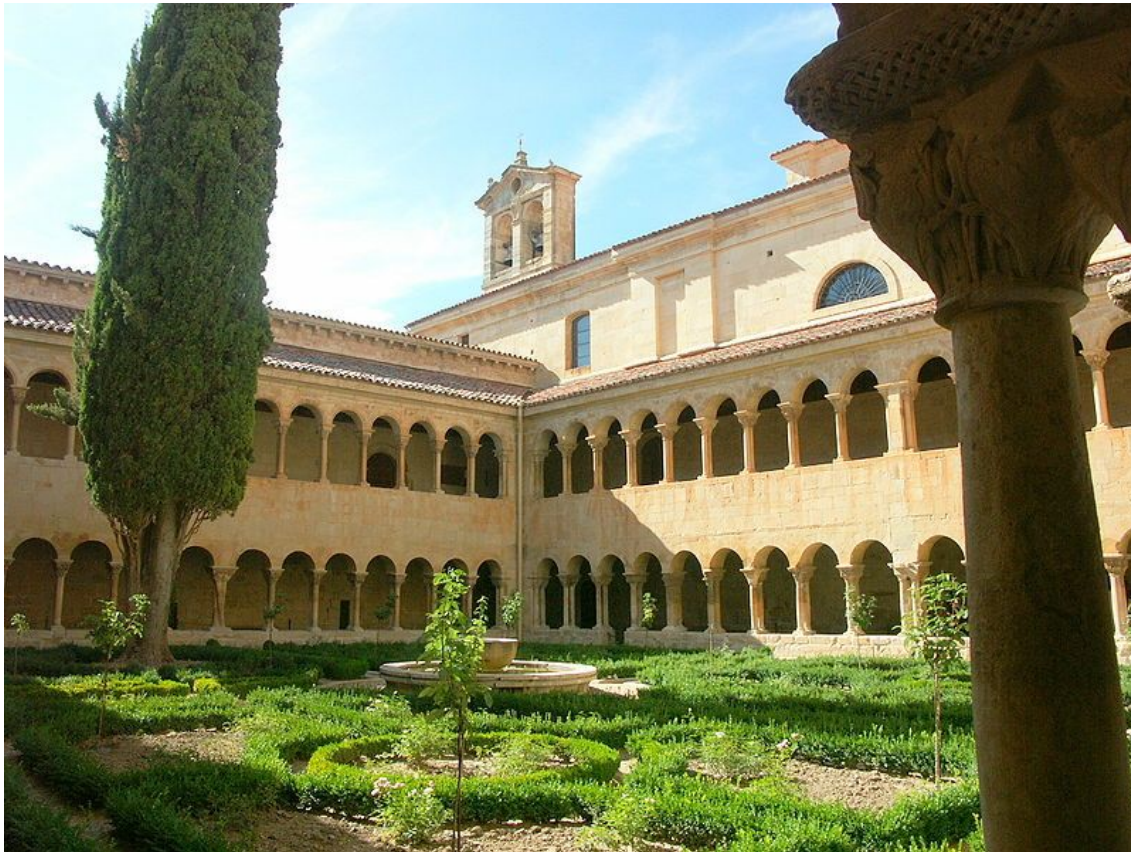
Monasterio Santo Domingo de Silos

El monasterio , concebido para el recogimiento, el trabajo y la oración de una comunidad que decide entregar su vida al servicio de Dios tiene el mismo aspecto de solidez dado por el material empleado. Su núcleo dominante está en el claustro , lugar de meditación ubicado en el centro del espacio. A su alrededor se organizan la iglesia, la sala capitular, el refectorio, el hospicio y el hospital.