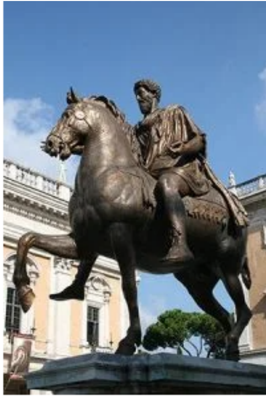
Estatua ecuestre de Marco Aurelio.

Los relieves fueron otro de los géneros más trabajados e importantes. Por ejemplo, los funerarios inscritos en los sarcófagos, novedad que repercutirá en el arte cristiano. Sin embargo, en el relieve histórico la propaganda política toma aún más fuerza mediante su inscripción en los monumentos arquitectónicos que narran las glorias de los ejércitos romanos y su extensión territorial. Altares monumentales, columnas conmemorativas y arcos de triunfo serán los monumentos de tipo conmemorativo.