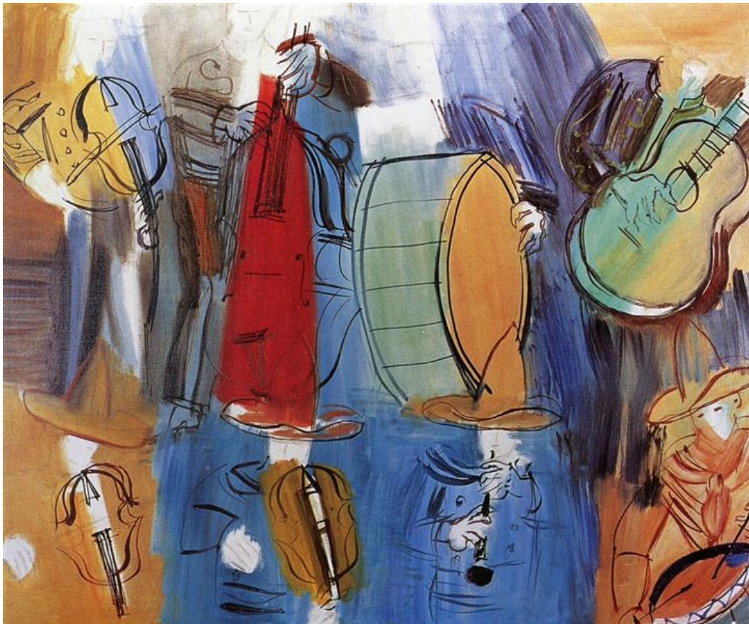
Los músicos mexicanos (1951) Raoul Dufy.

Exponentes: Henri Manguin (1874-1949), Raoul Dufy (1877-1953) y Henri Matisse (1869-1954).