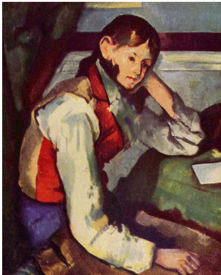
El muchacho del chaleco rojo (1888) Paul Cézanne.

Exponentes: Claude Monet (1840-1926), Edouard Degas (1834-1917), Camille Pissarro (1830-1903), Auguste Renoir (1841-1920), Paul Cézanne (1839-1906) y Alfred Sisley (1839-1899).