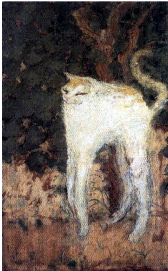
El gato blanco (1894) pierre Bonnard.

Exponentes: Maurice Denis (1870-1943), Felix Vallotton (1825-1865), Paul Serusier (1862-1927), Pierre Bonnard (1867-1947), Édouard Vuillard (1868-1940) y Émile Bernard (1868-1914).