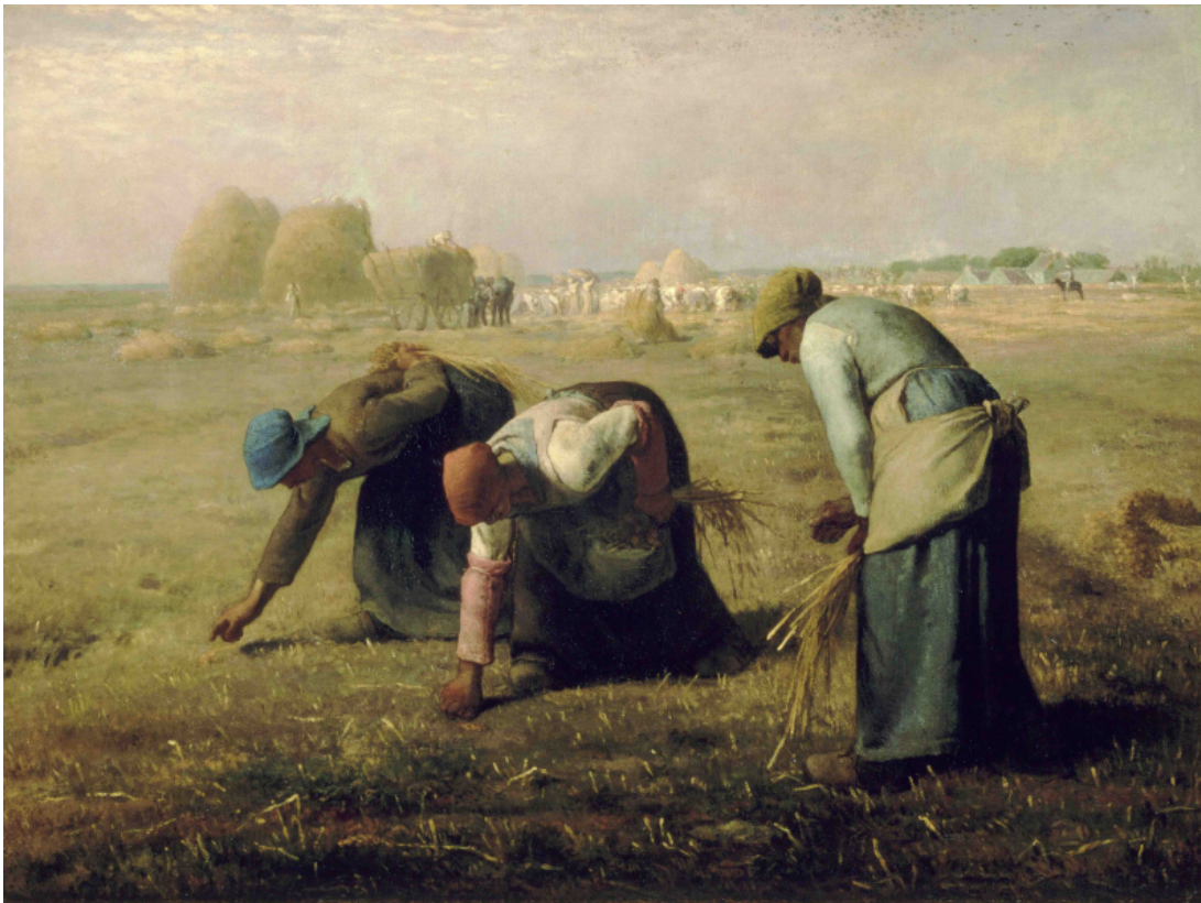
Las espigadoras (1857) Jean-Francois Millet.

Exponentes: Jean-Francois Millet (1814-1875), Gustave Courbet (1819-1877) y Alfred Stevens (1823-1906).