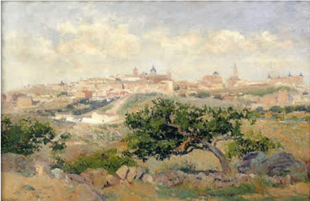
Vista de Toledo (1907) Aureliano de Beruete.

Exponentes en pintura: Marie Bashkirtseff (1858-1884), Jules Bastien-Lepage (1848-1884) y Aureliano de Beruete (1845-1912).