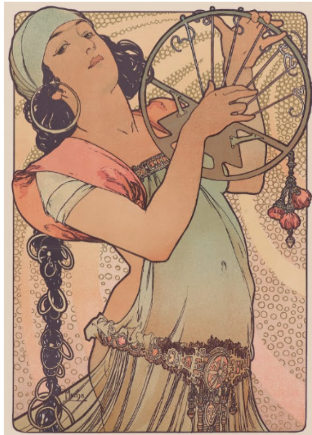
Salomé (1897) Alfons Mucha.

Exponentes: Héctor Guimard (1876-1934), Alfons Mucha (1860-1939) y el Movimiento Arts and Crafts (William Morris, 1834-1896).