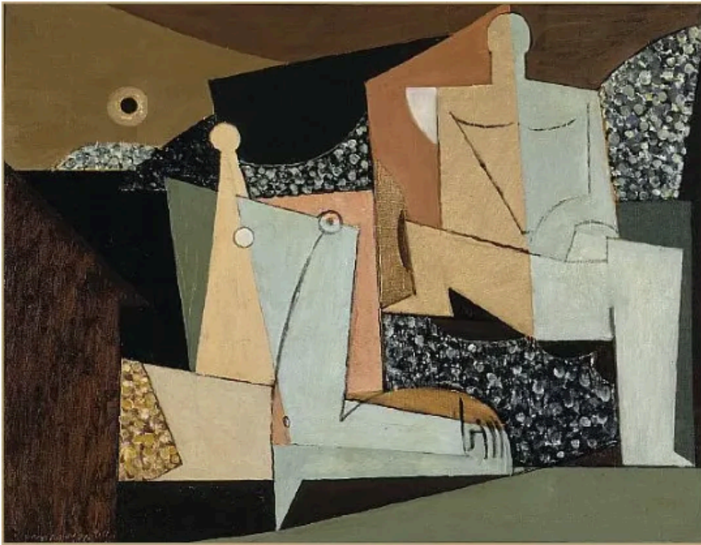
Figuras en una playa (1930) Louis Marcoussis.

Exponentes: Pablo Ruiz Picasso (1881-1973), Georges Braque (1882-1963), Juan Gris (1887-1927) y Louis Marcoussis (1878-1941).