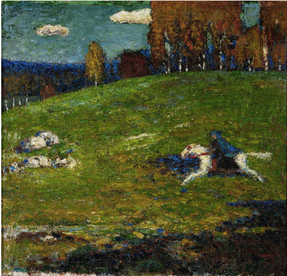
El jinete azul (1903) Wassily Kandinsky.

Referencia: Escuela Europea. (2022). Los Movimientos Artísticos en el Arte: ¿Cuáles son los principales? Recuperado de: https://www.escueladesarts.com/blog/movimientos-artisticos-importantes-historia/