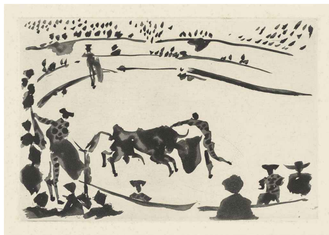
Dibujo de la serie de Tauromaquia (1959).

Por su parte, Picasso, consciente de su poder en el mundo del arte, se limitó a ignorar al catalán, algo que no le sentó nada bien a este, ya que siguió atacándole, colocándose él como el abanderado del verdadero arte y tachando al malagueño como el destructor del arte clásico debido a la invención del cubismo, una técnica que, recordemos, él mismo utilizó en sus comienzos. Sin embargo, al mismo tiempo que denigraba la obra de Picasso, Dalí seguía inspirándose en ella de una forma muy clara para crear su arte. A su vez, le escribía postales y cartas adulándolo que, por supuesto, Picasso ignoraba.