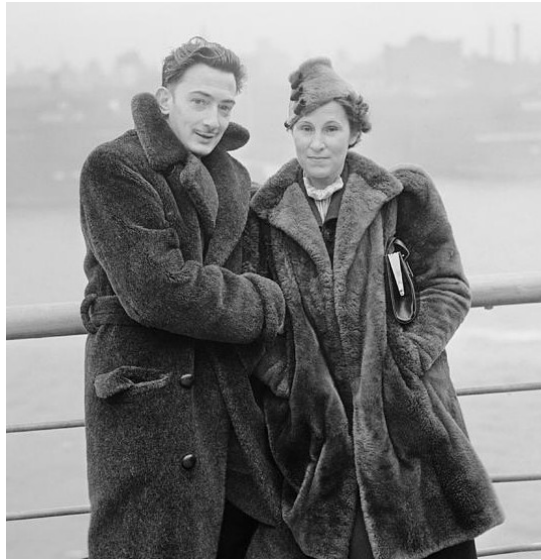
Dalí y Gala llegando a Nueva York en 1934.

Por su parte, Picasso, consciente de su poder en el mundo del arte, se limitó a ignorar al catalán, algo que no le sentó nada bien a este, ya que siguió atacándole, colocándose él como el abanderado del verdadero arte y tachando al malagueño como el destructor del arte clásico debido a la invención del cubismo, una técnica que, recordemos, él mismo utilizó en sus comienzos. Sin embargo, al mismo tiempo que denigraba la obra de Picasso, Dalí seguía inspirándose en ella de una forma muy clara para crear su arte. A su vez, le escribía postales y cartas adulándolo que, por supuesto, Picasso ignoraba.