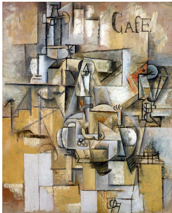
La paloma con guisantes (1911) de Picasso.

Dalí estudió y analizó a fondo la figura de Picasso, a la que veía como un referente, alguien quien quería ser en su futuro. Tomó como referencia los mismos autores que él, con especial relevancia en la figura de Velázquez, de la que posteriormente tomaría hasta su característico bigote y corte de pelo, para poder asemejarse todo lo posible y alcanzar el éxito que él tenía. La admiración era tan grande, que, en sus inicios, Salvador Dalí imitaba el estilo de Picasso, tanto en la forma de vestir como en la de pintar, ya que realizó numerosas obras cubistas en las que se percibe claramente la influencia de Picasso.