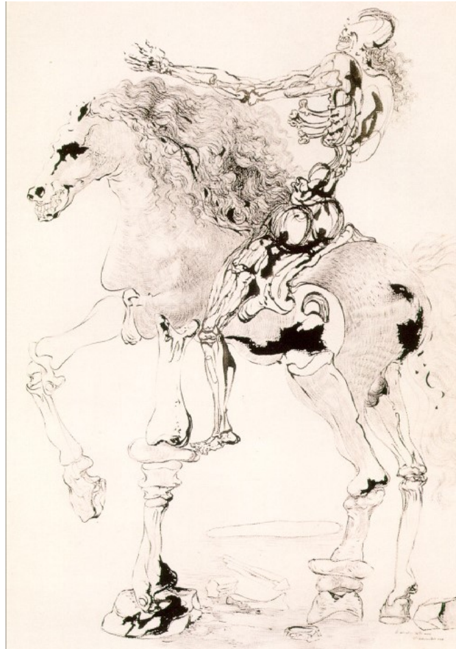
El caballero de la muerte (1957) de Salvador Dalí.

Tal era su obsesión por el malagueño que Dalí llegó a escribir un libro titulado Picasso y yo, en el que se recoge el epistolario completo que intercambiaron (solo encontramos una postal firmada por Picasso hacia Dalí), así como todos los textos que este le dedicó al pintor malagueño a lo largo de su vida, que no son pocos.