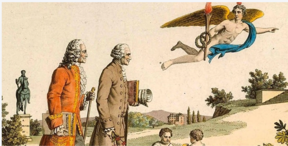
Voltaire y Rousseau fueron representantes destacados de la Ilustración.