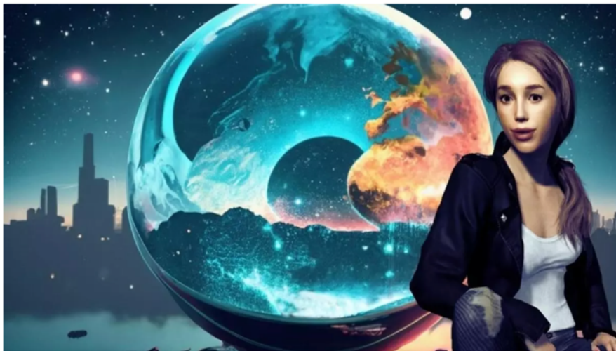
La revolución tecnológica y su impacto en nuestra vida cotidiana.

Estas situaciones nos recuerdan que, a pesar de los avances tecnológicos, nuestra mente todavía está programada para los métodos tradicionales de conducción. Sin embargo, a medida que nos acostumbremos cada vez más a esta nueva forma de transporte, podremos apreciar aún más los beneficios que los coches autónomos nos ofrecen en términos de seguridad, comodidad y eficiencia.