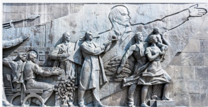
La Revolución rusa creó un Estado socialista que llevó a la formación de la URSS.