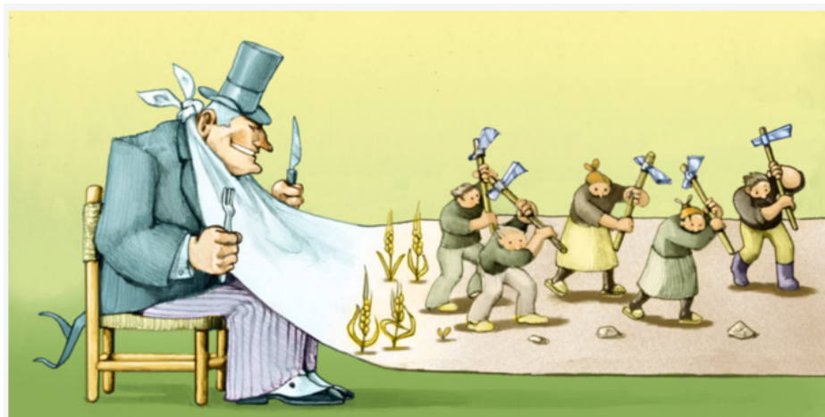
El neoliberalismo promueve que el poder recaiga en una minoría capitalistas.

La única salida, el único modo de salvar el planeta y la civilización, es un renacimiento de la historia. Debemos revivir la Ilustración y volver a comprometernos con honrar sus valores de libertad, respeto al conocimiento y democracia.