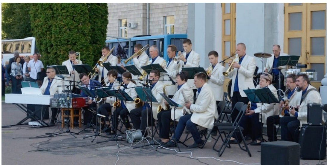
Un grupo social asigna roles sociales específicos a cada integrante.

Es importante no confundir los grupos sociales con las clases sociales. En un mismo grupo social pueden ser consideradas personas de distintos estratos, pero con el mismo propósito social.