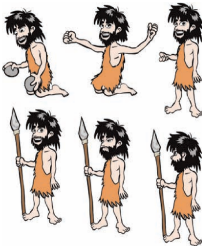
Figura 1.1 El hombre prehistórico necesitaba saber cuántas y cuáles eran sus pertenencias.

Pensemos en el hombre prehistórico, que necesitaba conocer cuáles y cuántas eran sus pertenencias para poder sobrevivir. Por tal motivo empezó a usar su ingenio y a usar los dedos de sus manos, con los cuales aprendió a contar. Después, con las necesidades de la sociedad y el crecimiento de las distintas culturas y negocios se hizo factible la administración de los recursos, propiedades y bienes.