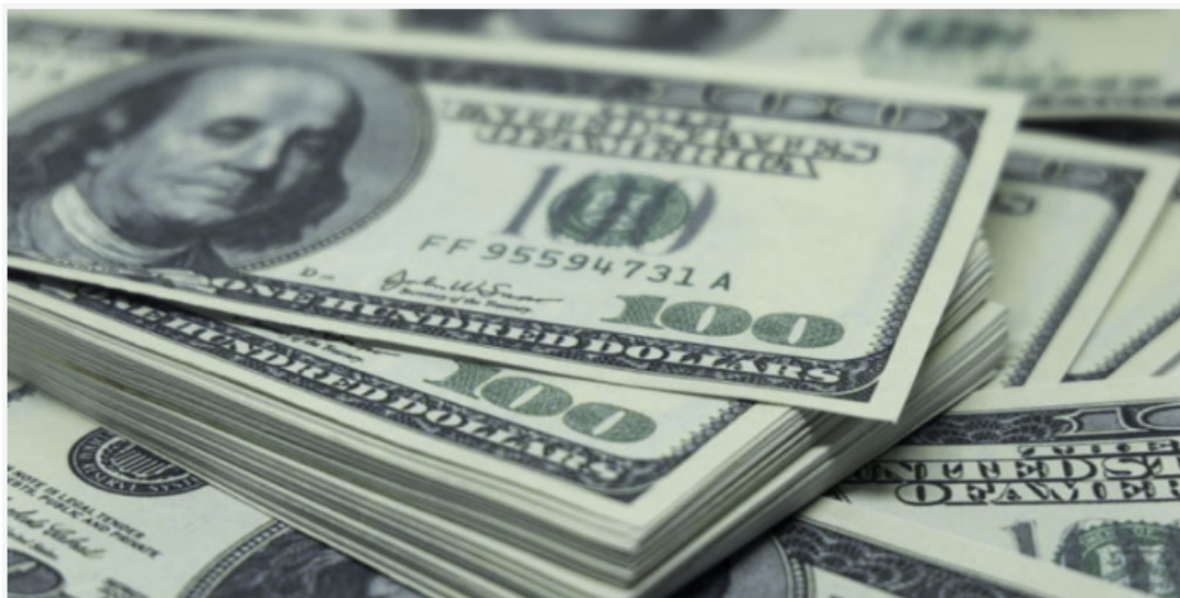
Cada billete o moneda tiene un valor establecido y aceptado universalmente.

Se puede hablar básicamente de dos tipos de dinero físico: el metálico, también llamado moneda, y que posee bajo valor; y el de papel, también conocido como billetes, el cual es realizado en un tipo de papel especial y cuyo valor monetario es mayor que el primero y lo muestra de forma impresa.