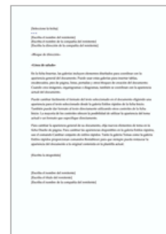
Carta de combinació...