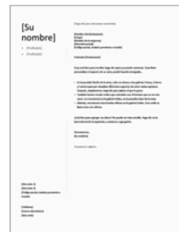
Carta de presentación