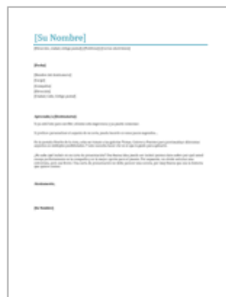
Carta de presentación