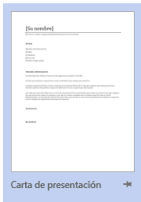
Carta de presentación