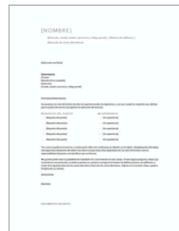
Carta de presentación c...