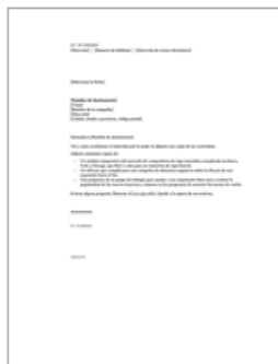
Carta de presentación c...