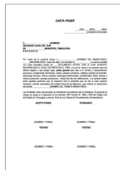
CARTA PODER 1