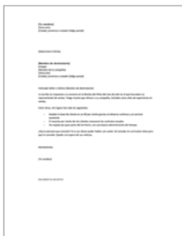
Carta de presentación p...